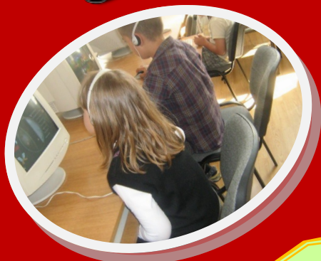
занимания по интереси